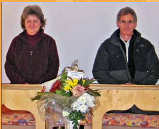
... mit Dr. Jon Kabat-Zinn 2006 in der Bonner Praxis